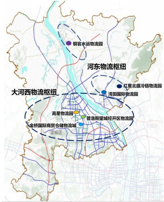
图 1 物流枢纽与物流产业园分布图